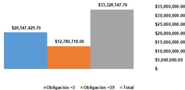
Recuadación Por Concepto Junio-Diciembre 2023