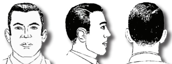
Corte de cabello uniforme (Parejo de los lados y de arriba)